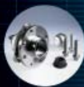
A Rodamientos de rueda