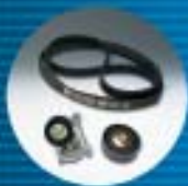
F Correas y tensores Multi-V