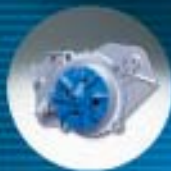
E Bombas de agua