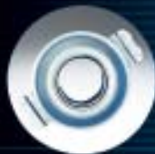
C Rodamientos de embrague y actuadores hidráulicos