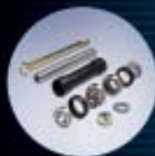
D Brazos de suspensión