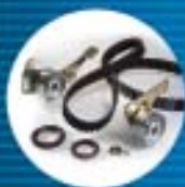
G Correas y tensores de Distribución