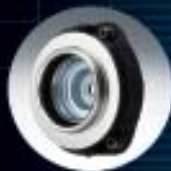
B Rodamientos de suspensión